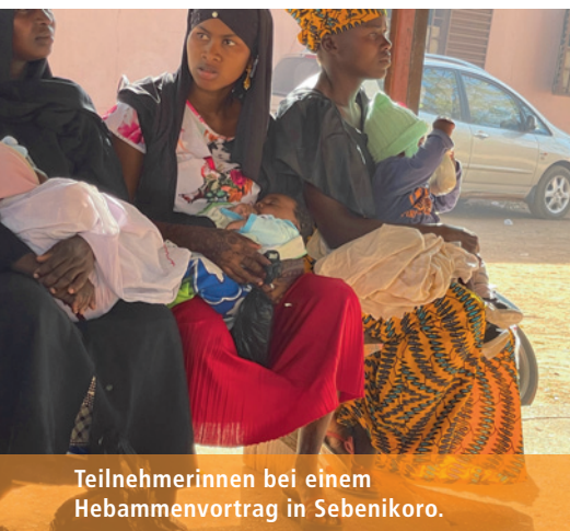
Teilnehmerinnen bei einem Hebammenvortrag in Sebenikoro.