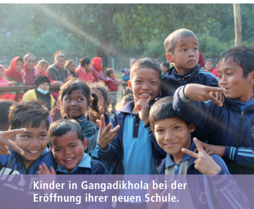
Kinder in Gangadikhola bei der Eröffnung ihrer neuen Schule.