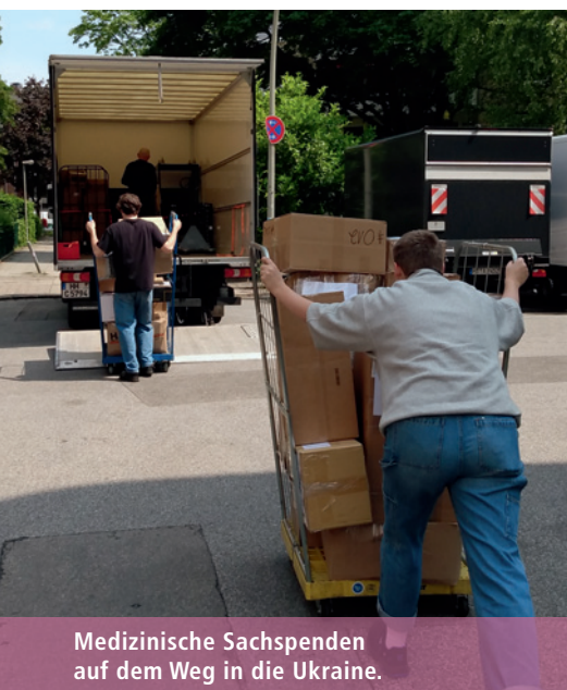
Medizinische Sachspenden auf dem Weg in die Ukraine.